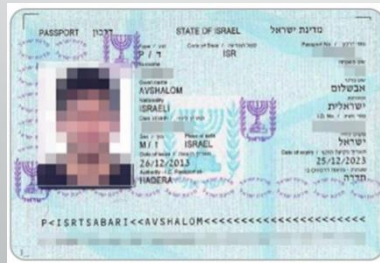
דרכון ישראלי בתוקף