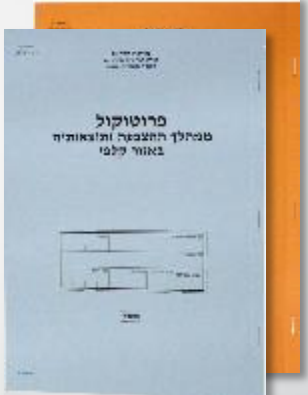
פרוטוקול הקלפי (2 עותקים)