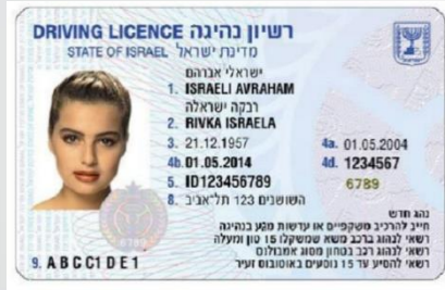
רישיון נהיגה בתוקף