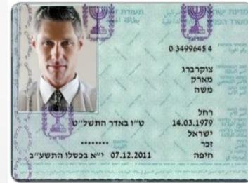
תעודת זהות רגילה