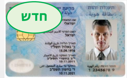
תעודת זהות ביומטרית בתוקף