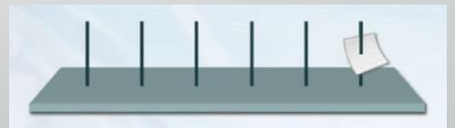
מתקן לנעיצת הפתקים